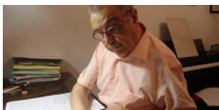
Joan Guinjoan @www.joanguinjoan.com

Joan Guinjoan será el protagonista de la nueva edición de la Carta Blanca a cuya obra dedicará tres conciertos de cámara y dos sinfónicos además de una exposición, un encuentro y la proyección su ópera Gaudi y que se desarrollará entre el 29 de febrero y el 13 de marzo.